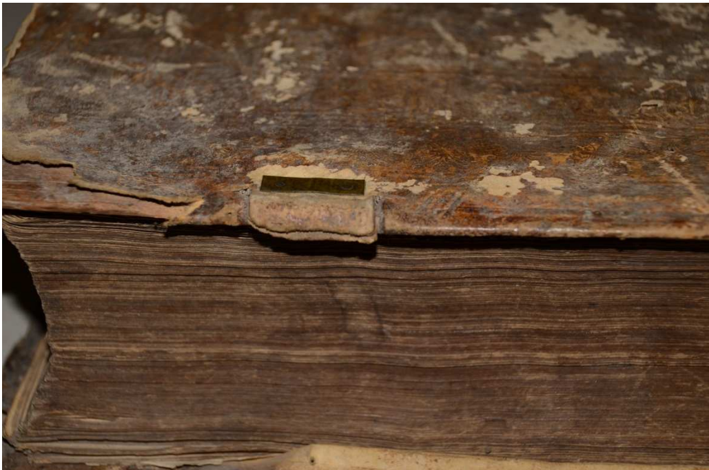
6. kép A leszakadt bőrszj