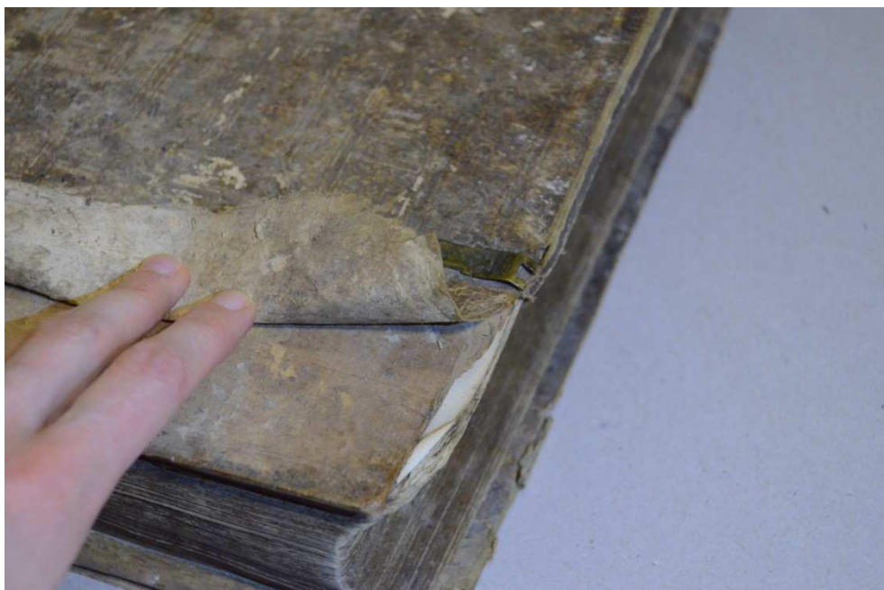
4. kép Az első tábla letört sarka