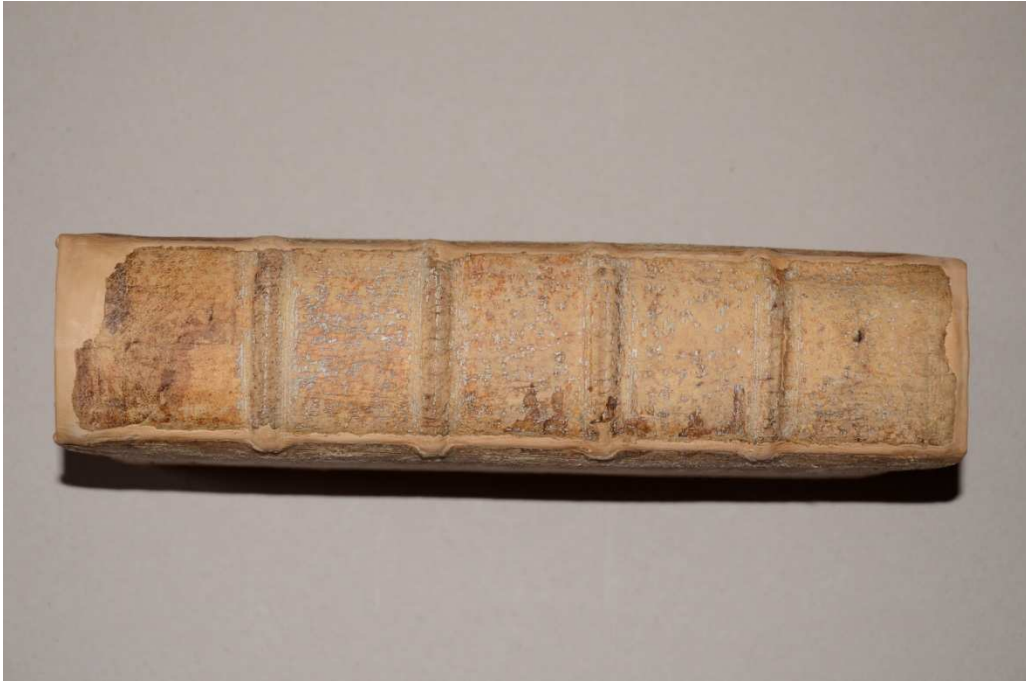
17. kép A könyv gerince restaurálás után