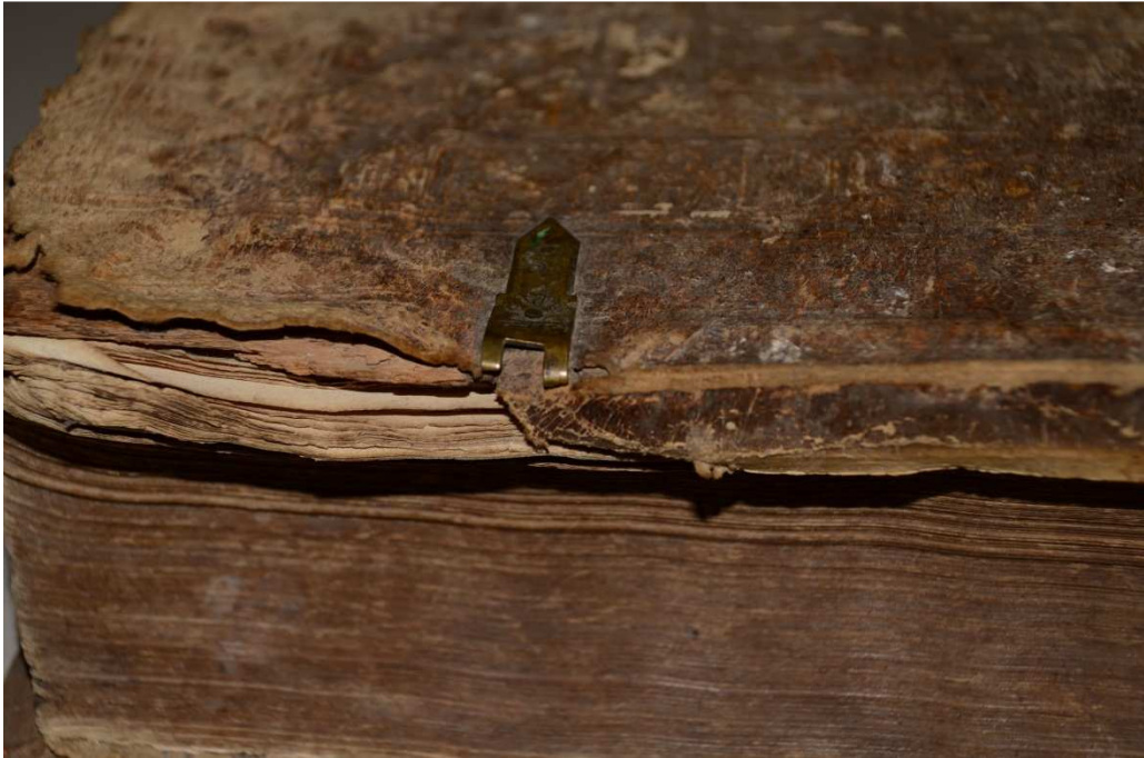
5. kép A törött csat