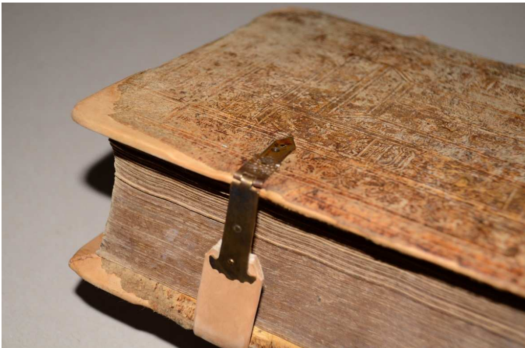
18. kép A pótolts és restaurált csatok