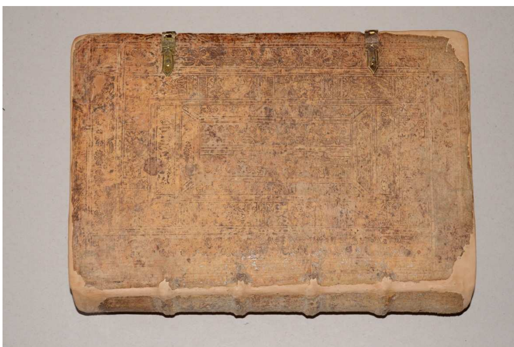
16. kép A kész könyv