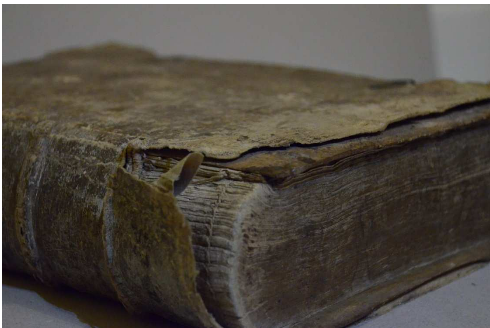
2. kép A kopott és szakadozott bőrborítás