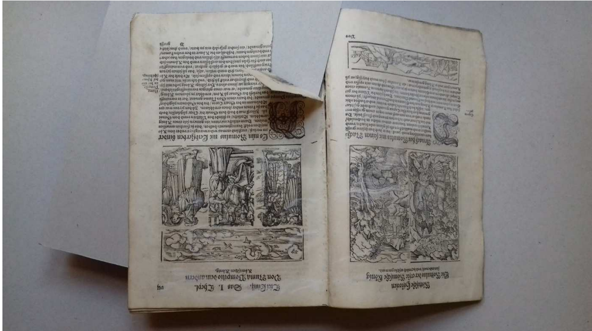
11. kép Szakadás a könyv belsejében