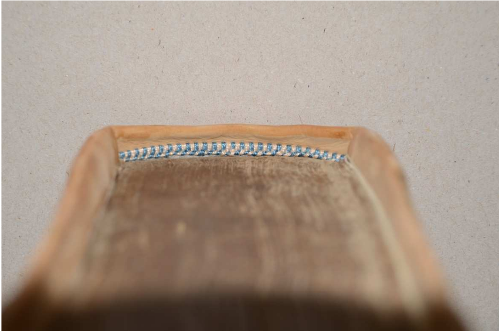
19. kép A könyv új oromszegője