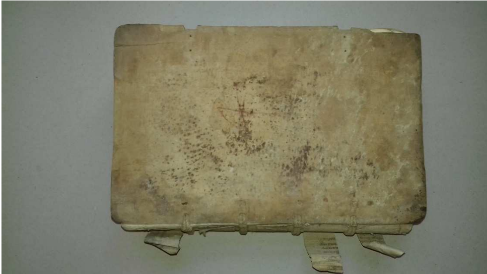
9. kép A könyv a lefejtett bőrborítás nélkül