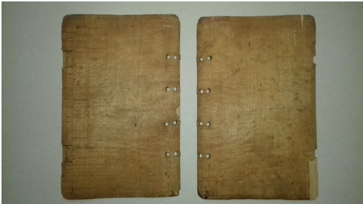
14. kép Fatáblák restaurálás után