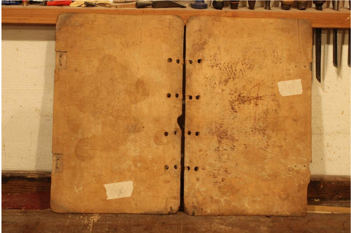
13. kép Fatáblák restaurálás előtt