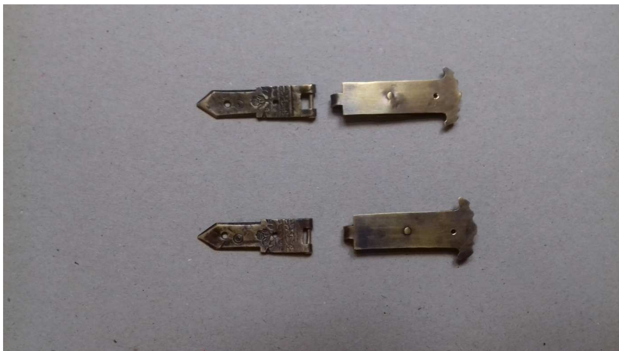
15. kép A restaurált csatok a pótolt párjukkal