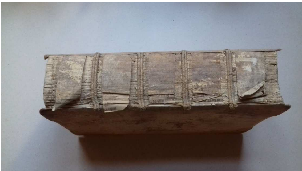
10. kép A pergamensíkok a könyv gerincén