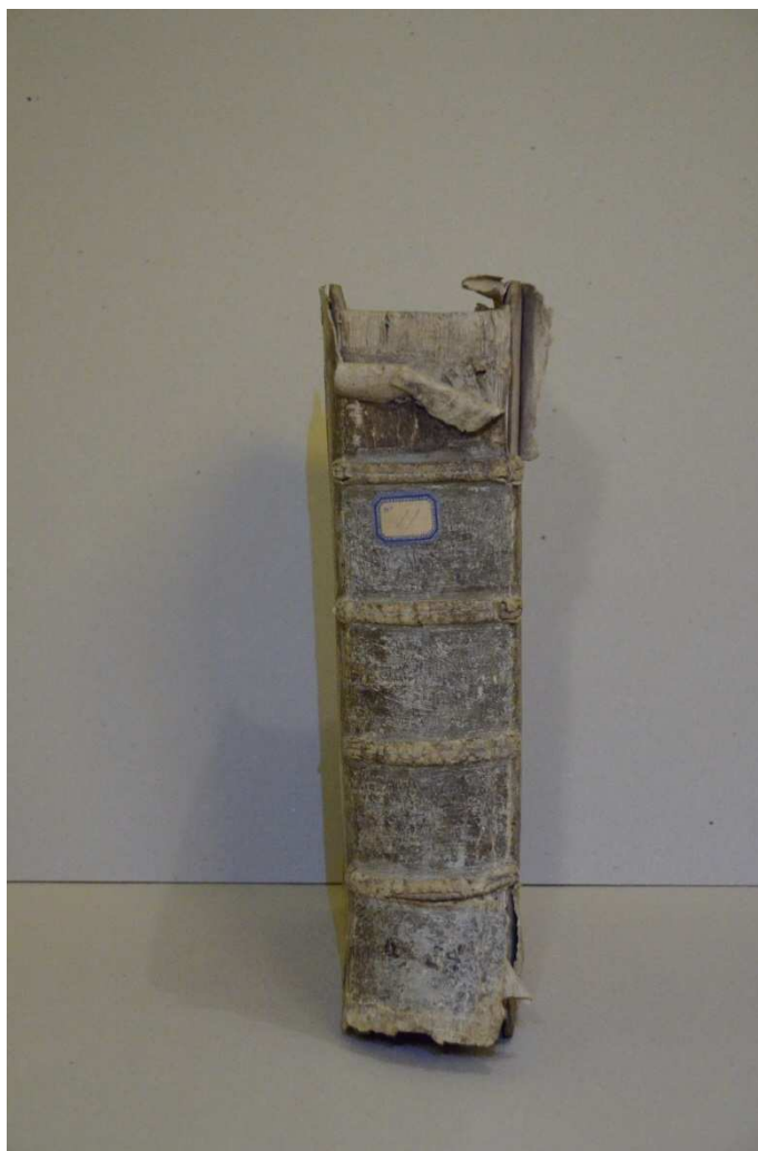
3. kép A könyv gerince átvételkor