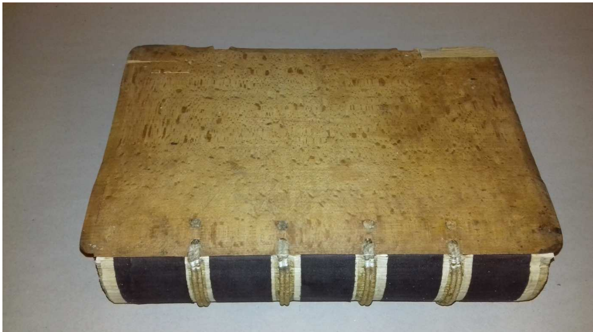
12. kép Az újra betáblázott könyv