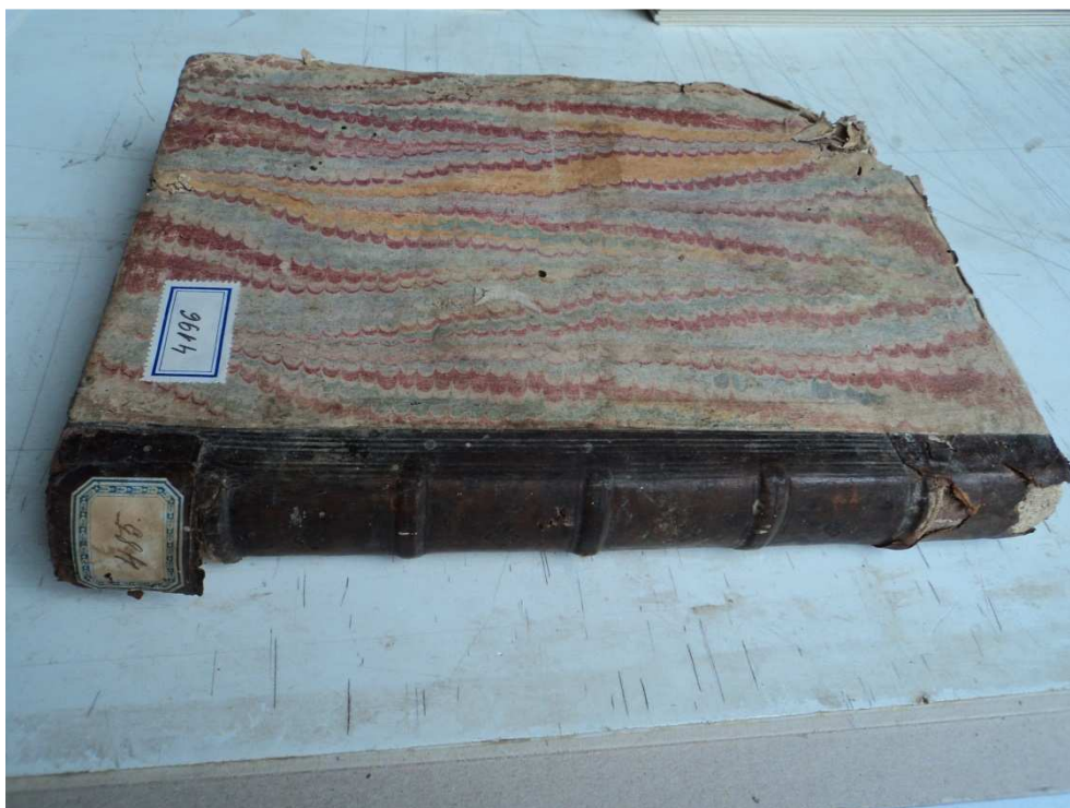
1. ábra A könyv átvételi állapota