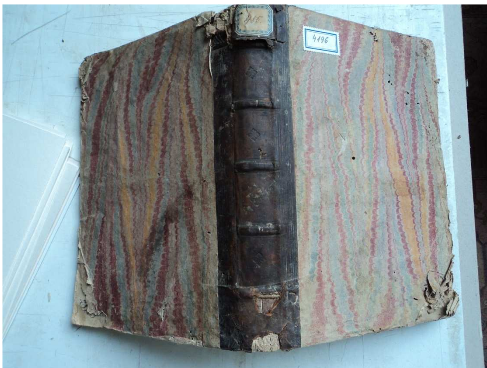
2. ábra A könyv átvételi állapota