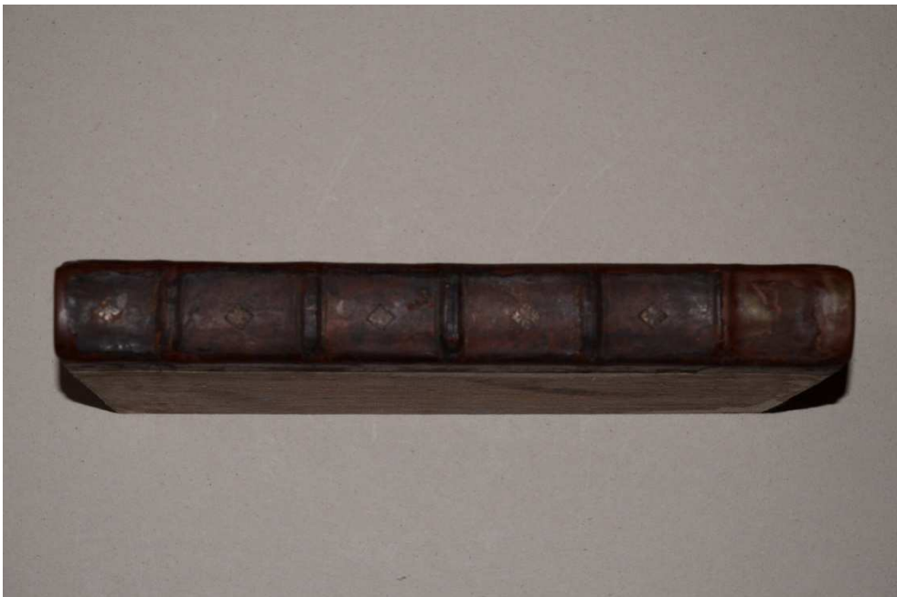
8. ábra A restaurált könyv gerince