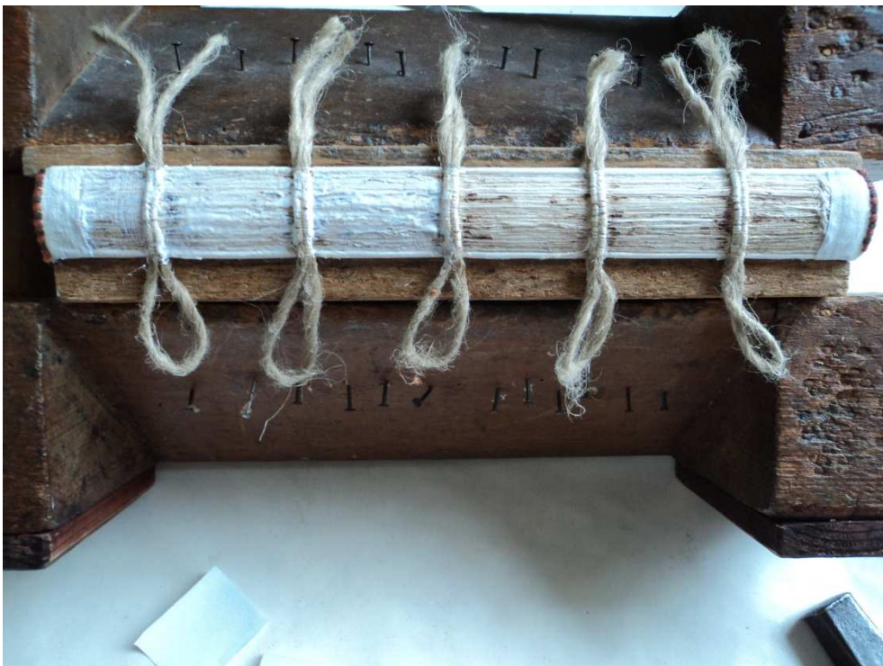
6. ábra A könyvtest újrafűzése