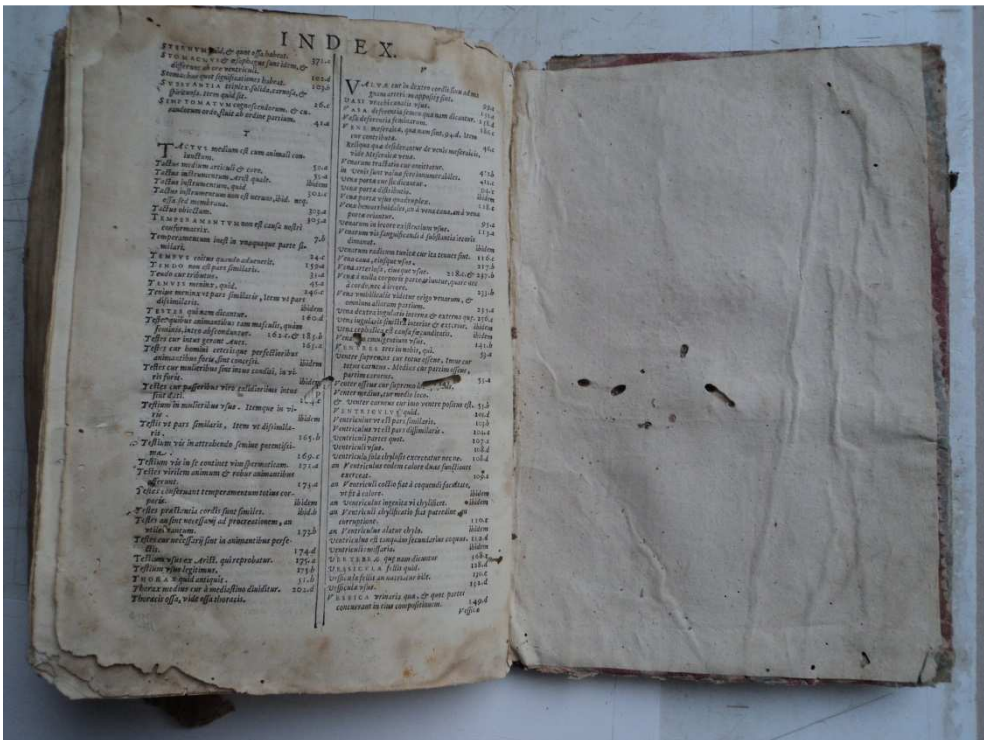
4. ábra A könyv utolsó oldala restaurálás előtt