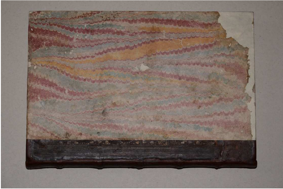
7. ábra A restaurált könyv első táblája