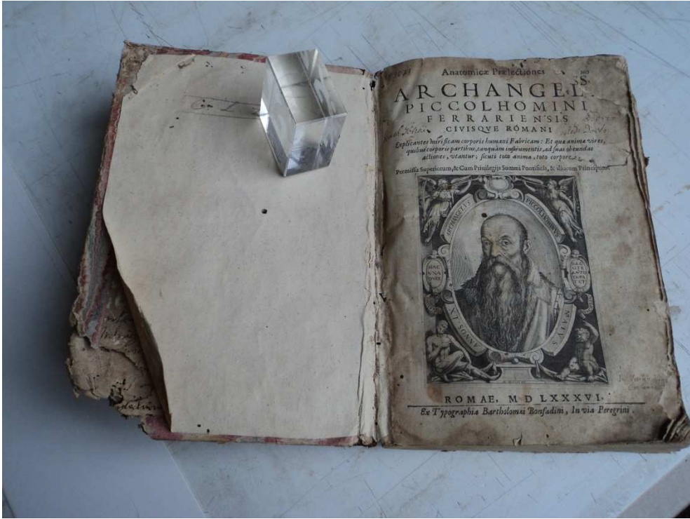
3. ábra A címoldal restaurálás előtt